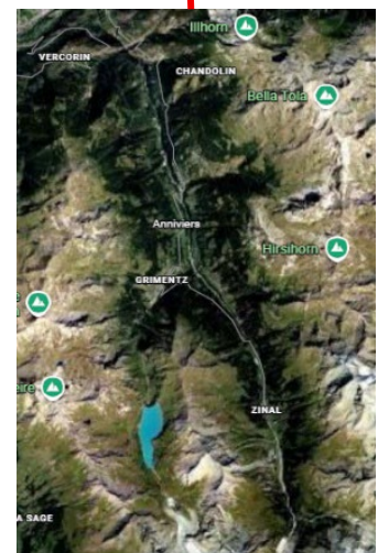
Les Alpes Valaisannes