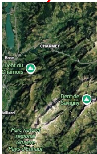
Les Alpes Fribourgeoises & Pays d'Enhaut